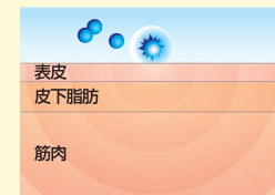
微振動によって発熱に変わります

マイクロバブルが次々と消滅するときに発生する微振動が皮膚代謝を活性化させ、ペットへのマッサージ効果も期待できるでしょう。