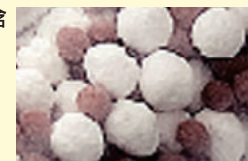
セラミックボール

シャワーヘッド本体だけでも水道水に含まれる塩素などの有害物質の低減効果があります。さらに残留塩素を低減するセラミックボールも内蔵しています。