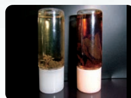
(右：ケアウォーター)