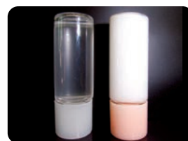
(右：ケアウォーター)